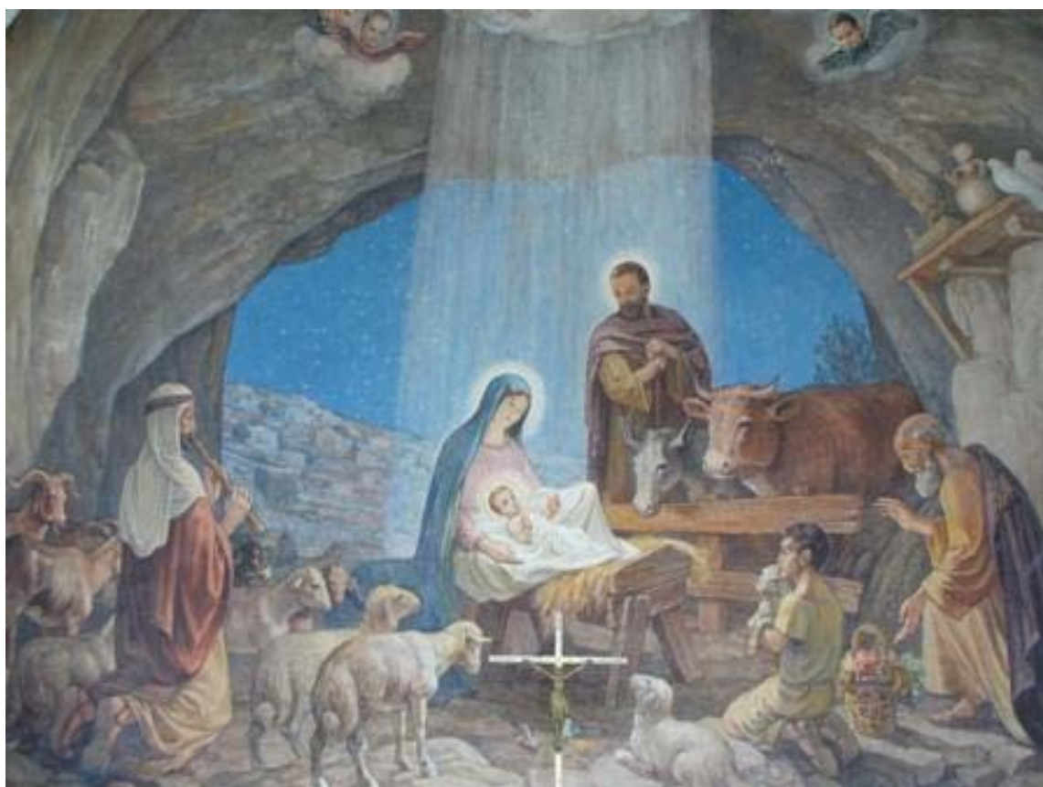
(Fresco del Nacimiento de Jesús, Iglesia cerca de la Cueva de los Pastores (Belén))

Parròquia de Valldoreix i Mira-sol Arxiprestat de Sant Cugat